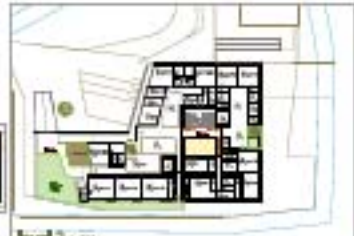
level 2 1/100