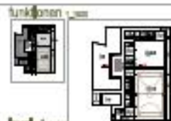
level -1 1/100