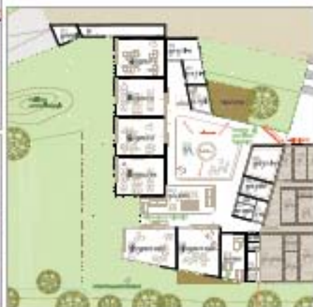
ebener 2 1/100