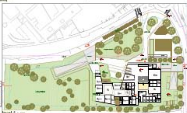
level 1 1/100