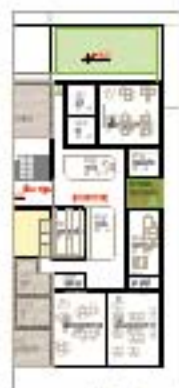
ebener 6 1/100