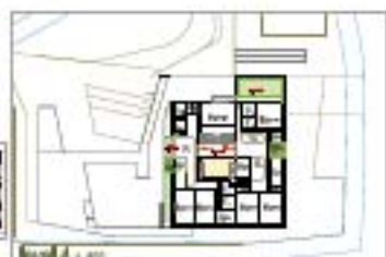
level 4 1/100

die raumstruktur des bildungscampus ist ein zentraler hof, der durch eine raumstruktur aus bildungscampus und gasometerumfeld umgeben ist. die raumstruktur ist ein zentraler hof, der durch eine raumstruktur aus bildungscampus und gasometerumfeld umgeben ist.