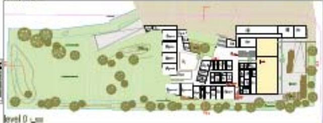
level 0 1/100