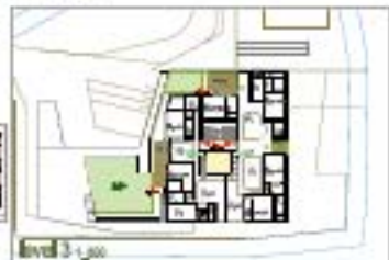
level 3 1/100