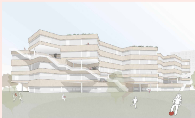
SCHAU-BILD - BLICK AUS DEM GARTEN