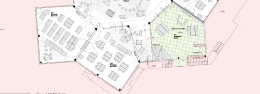
GRUNDRISS BILDUNGSCLUSTER 2 1:500